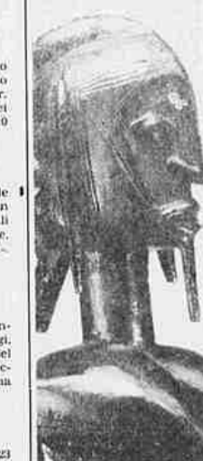
Africa scultura del Mali