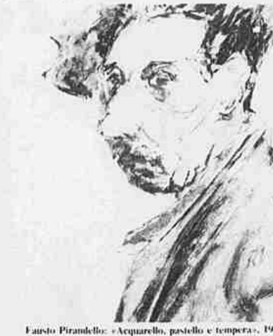
Fausto Pirandello: «Acquello, pastello e tempera», 1945