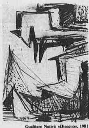
Gualtiero Nativi: «Disegno», 1981