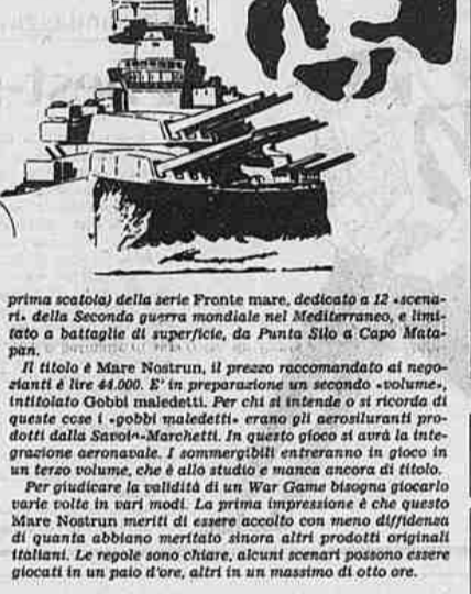
prima scotola) della serie Fronte mare, dedicato a 12 «scenari» della Seconda guerra mondiale nel Mediterraneo, e intitolato a battaglie di superficie, da Punta Siro a Capo Matapan.

Per giudicare la validità di un War Game bisogna giocare varie volte in vari modi. La prima impressione è che questo Mare Nostrum meriti di essere accolto con meno diffidenza di quanto abbiamo meritato finora altri prodotti originali italiani. Le regole sono chiare, alcuni scenari possono essere giocati in un paio d'ore, altri in un massimo di otto ore.