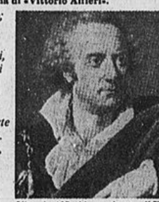
Vittorio Alfieri in un ritratto di Fabre

In questo «acrostico anagrammatico» di Sandro Dorna si legge «Vittorio Alfieri» collegando sulla verticale la prima lettera di ciascun verso; e ciascun verso è anagramma di «Vittorio Alfieri».