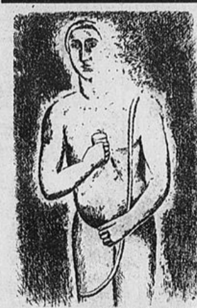
Carlo Carrà: «Uomo con bicchiere», 1923