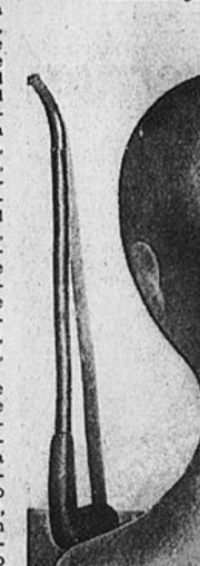
Giorgio Morandi: «Natura morta» (1918) part.