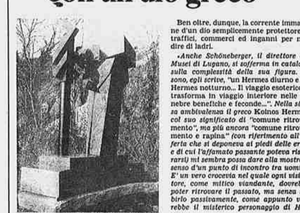
Pomodoro: «Hermes e mazza d'araldo»