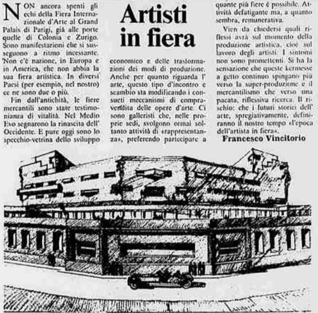
Clemente e Michele Busiri Vici: «Villa Guadino» (1928-'31)