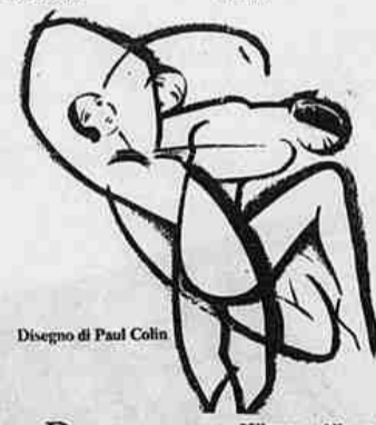
Disegno di Paul Collin

Catolice - MystFest 83 - Martedì prende il via la 4ª edizione del Festival internazionale del giallo e del mistero che andrà avanti fino al 5 luglio.