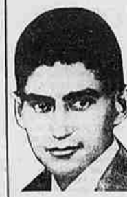
La soluzione del gioco «Ritratto cinese», apparso sull'ultimo numero di Tuttolibri, era: Franz Kafka.