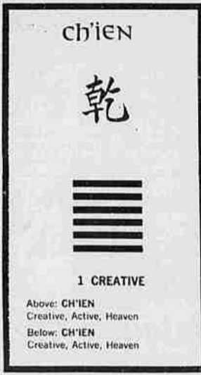
1 CREATIVE Above: CH'EN Creative, Active, Heaven Below: CH'EN Creative, Active, Heaven