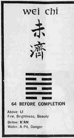
64 BEFORE COMPLETION Above: LI Fire, Brightness, Beauty Below: K'AN Water, A Pit, Danger

La prima e l'ultima carta del mazzo di «Yijing» pubblicato in Svizzera da A. G. Mueller nel 1971 e distribuito in America dalla U. S. Games System Inc.