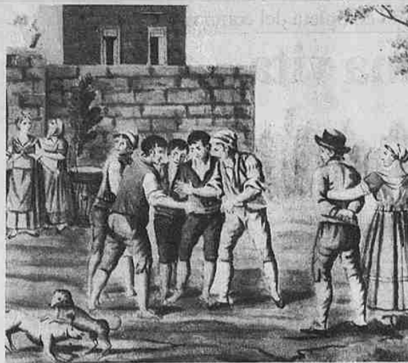
Un «gioco proibito», conosciuto da egizi e cinesi