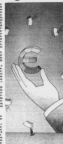
Illustrazione di J. Goffin (da Grafius annuo 80/81)

Il 27 febbraio divenne notizia dei bottrici ricatti, grazie a molti lettori, nel ruzo delle parole «iperconsonantiche»: parole che hanno tante consonanti (o che si scrivono con le «e» consonanti). Era risultato che possono cominciare a considerarsi «iperconsonantiche» le parole in cui il rapporto tra vocali e consonanti sia almeno di 1 a 2, pari a 0,5. Siccome nella lista di parole, abbiamo raggruppati gli esempi in 10 gruppi. Diciamo subito che ogni gruppo, avrà un titolo e un'acronimo. Il primo gruppo, avrà un titolo e un'acronimo. Il secondo gruppo, avrà un titolo e un'acronimo. Il terzo gruppo, avrà un titolo e un'acronimo. Il quarto gruppo, avrà un titolo e un'acronimo. Il quinto gruppo, avrà un titolo e un'acronimo. Il sesto gruppo, avrà un titolo e un'acronimo. Il settimo gruppo, avrà un titolo e un'acronimo. L'ottavo gruppo, avrà un titolo e un'acronimo. Il nono gruppo, avrà un titolo e un'acronimo. Il decimo gruppo, avrà un titolo e un'acronimo.