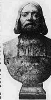
Francesco II Gonzaga

Al Teatro Tenda di piazza Mancini a Roma arriva gio-